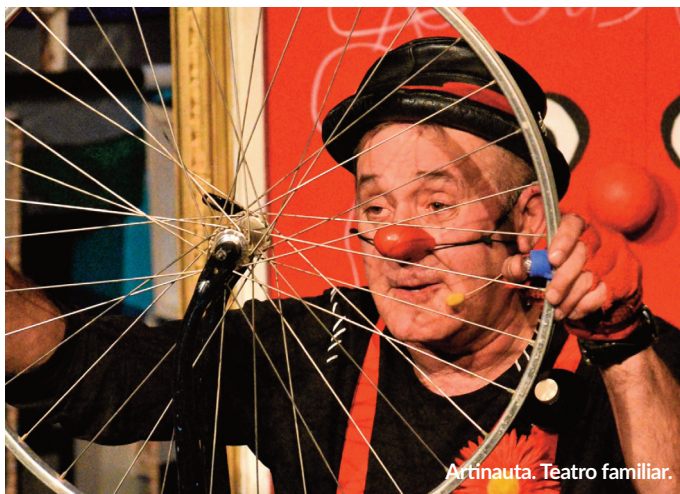
Artinauta. Teatro familiar.

Precio*: 8€ normal y reducida 6€ (50 entradas reducidas).