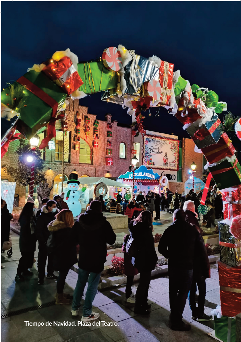
Tiempo de Navidad. Plaza del Teatro.