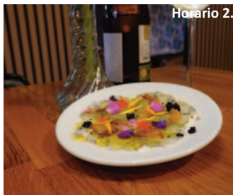
SENDERUELA MAR Y TIERRA Avda. Mari Martín, 1. 'Carpaccio de gamba blanca sobre sedoso pil pil de merluza y toques de lima fresca'