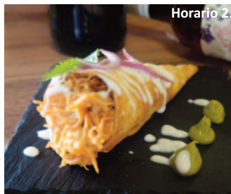
THE BOSS STREET FOOD C/ El Escorial, 36. 'Volcán de pollo chipotle'