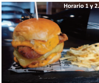
NOTTINGHAM PRISA C/ El Escorial, 44. 'Hamburguesa Ghost'