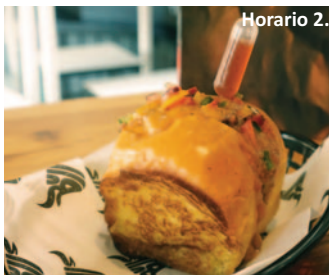
BULLS BURGER C/ Fidel Borrajo, 12 'Habana'