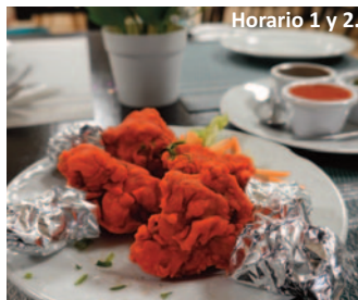
ROY'S RESTAURANTE INDIO Paseo del Alparrache, 6. 'Pollo lollipop con salsa a elegir'