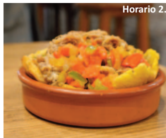
SOFIA'S RESTAURANTE C/ Pozo Concejo, 6. 'Patacón pulled pork'