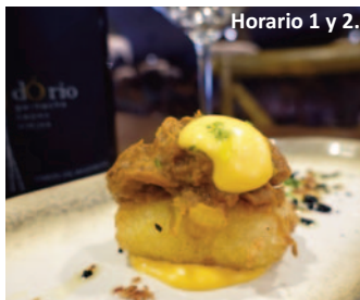
EN LA GLORIA Plaza de Segovia, 9. 'Nigiri de ternera'