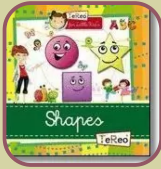
Shapes. TeReo for Little Kid's