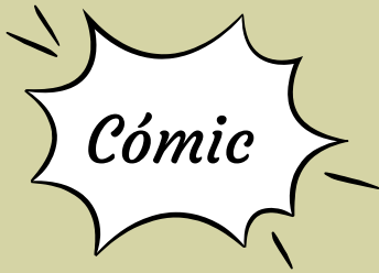
Policán 10: Madres Borrascosas. Dav Pilkey