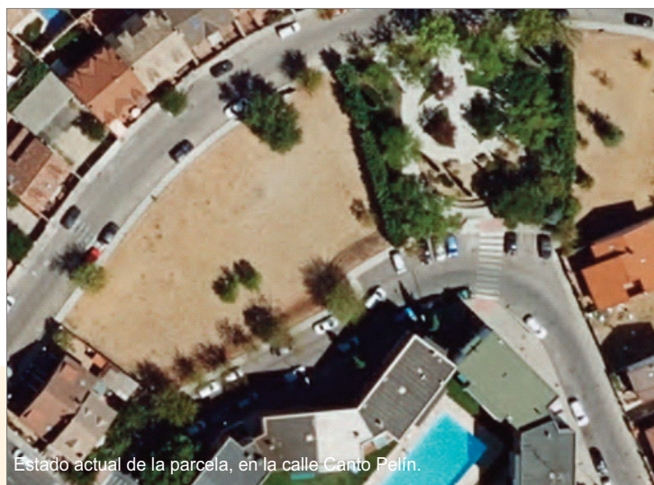
Estado actual de la parcela, en la calle Canto Pelín.

Por otro lado, en la parcela contigua se acondicionarán varias zonas estanciales y paseos distribuidas en terrazas, donde se construirá una pequeña instalación de parkour con rocódromo y se habilitará una zona para la práctica de petanca y chito.