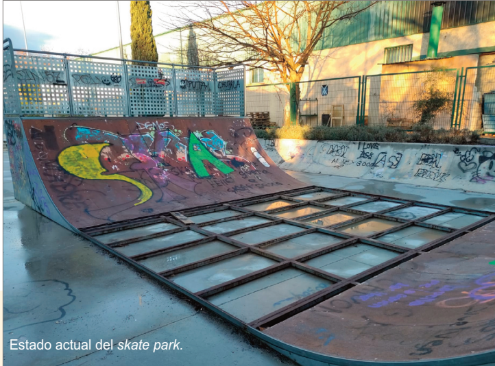
Estado actual del skate park.