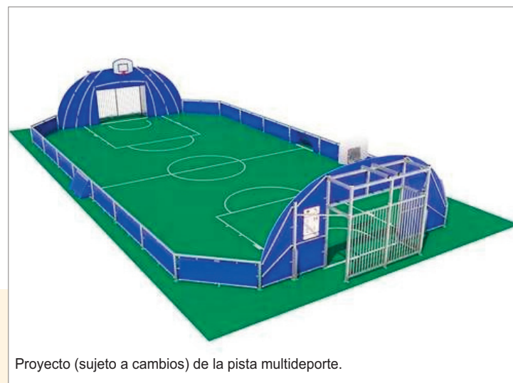
Proyecto (sujeto a cambios) de la pista multideporte.

En una parcela municipal se están acometiendo las obras para instalar una futura pista multideportiva para el uso y disfrute de los vecinos.