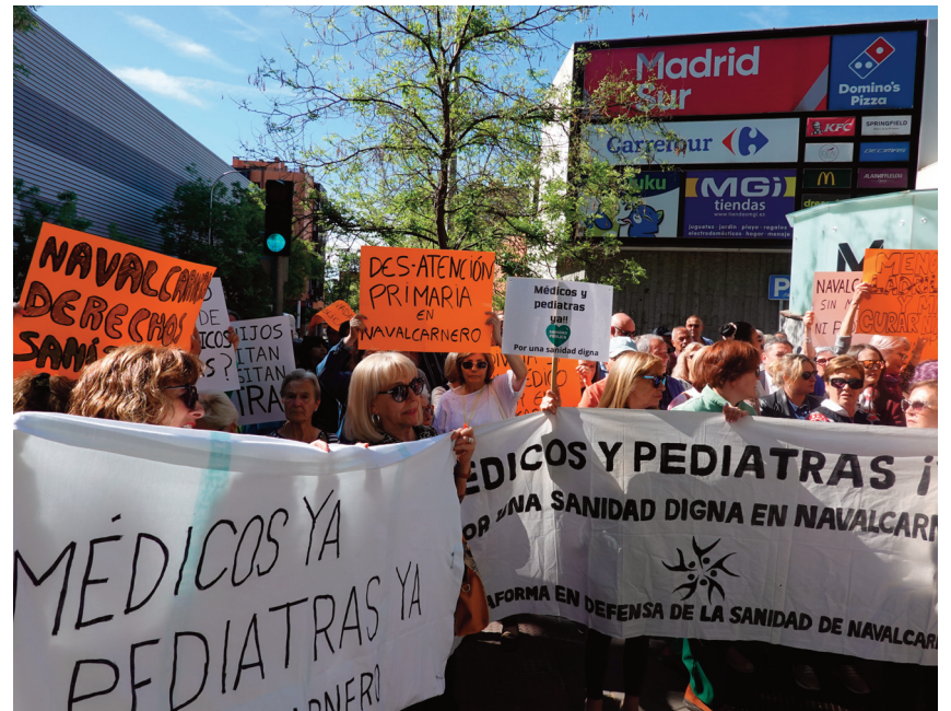
Decenas de navalcarneros se manifestaron en la Asamblea de Madrid.

El último informe elaborado por la concejalía de Sanidad del Ayuntamiento, correspondiente al mes de mayo, confirma una notable mejora de la situación, con una cobertura de más del 80 por ciento de las plazas de médicos (13 de 16) en ambos centros de salud (con previsión de mejorar de cara a septiembre). Sin embargo, según el mismo informe, el problema sigue en pediatría, donde solo están cubiertas 1,5 plazas de un total de 5.