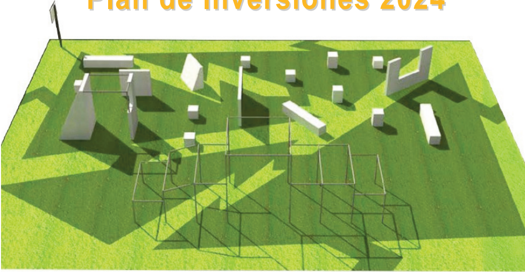
Proyecto de la zona de parkour que se ubicará entre la calle Coníferas y la avenida Casa Roque.

Continuando con la tendencia de equipar el municipio, el nuevo Plan de Inversiones ha arrancado este mes de junio con nuevos proyectos repartidos por toda la localidad.