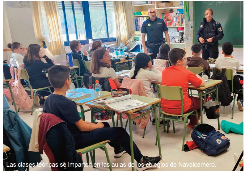
Las clases teóricas se imparten en las aulas de los colegios de Navalcarnero.

Por último, el tercer módulo va dirigido a los alumnos de la ESO. En él, los alumnos se desplazan hasta el salón de plenos del Ayuntamiento para escuchar charlas básicas sobre el Código Penal, la Ley del Menor, los centros de menores, el acoso escolar y las agresiones. A la vez, se les amplía el conocimiento sobre las redes sociales y la violencia de género -todo adaptado a la edad de los menores- y las bandas y el comportamiento cívico dentro del municipio. Estas charlas se im-