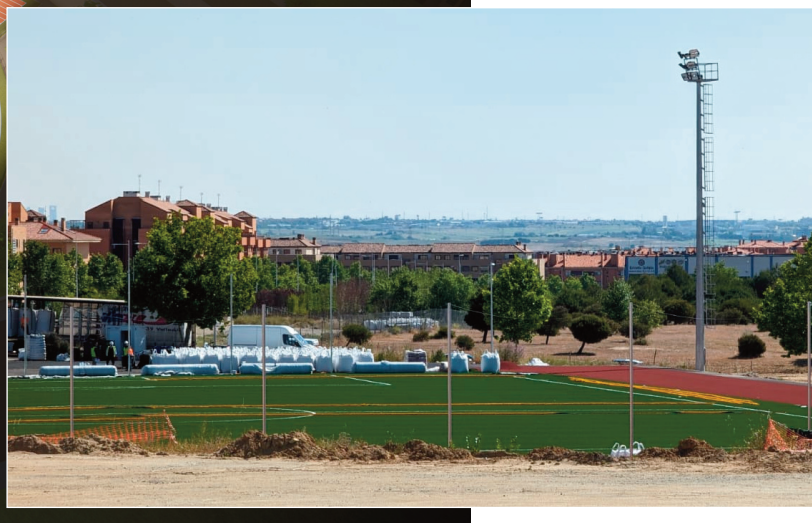
Vista aérea del proyecto de la pista de atletismo.