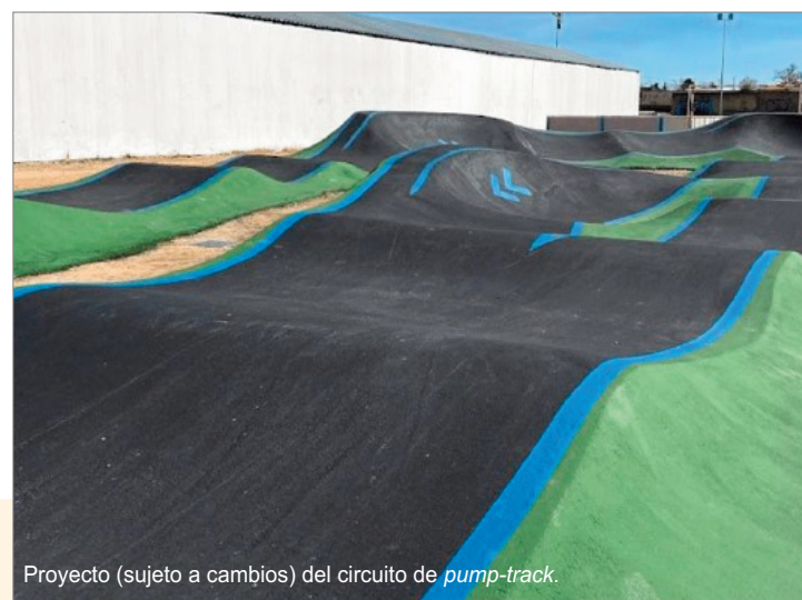
Proyecto (sujeto a cambios) del circuito de pump-track.