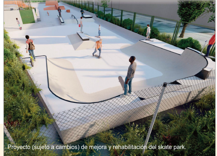
Proyecto (sujeto a cambios) de mejora y rehabilitación del skate park.