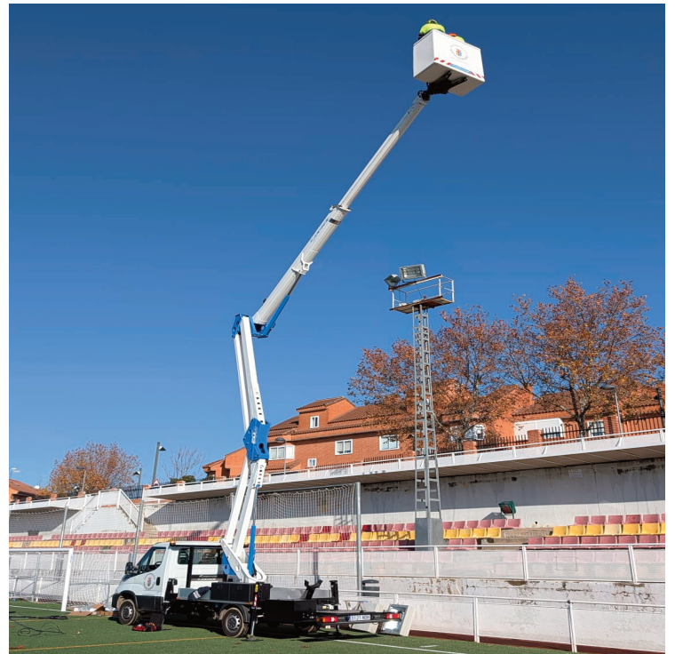
Trabajadores municipales realizando labores de mantenimiento del alumbrado.

El actual equipo de Gobierno inició un proceso de negociación que culminó con la resolución del contrato de mutuo acuerdo