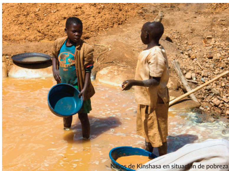
Niños de Kinshasa en situación de pobreza.