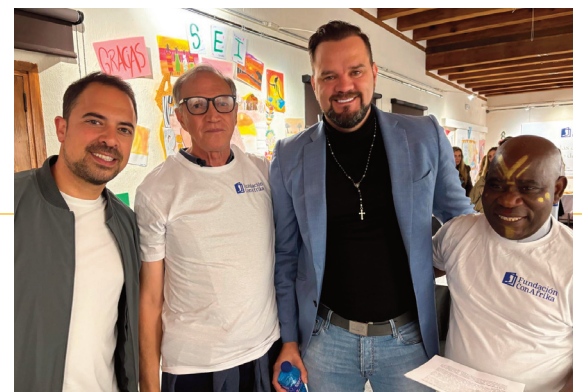
Imágenes de la exposición realizada en Navalcarnero el pasado mes de noviembre.