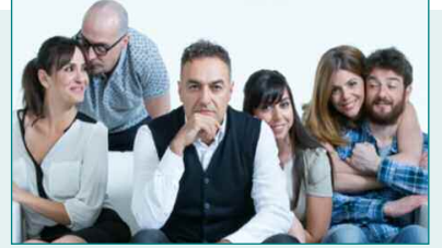
Salida cultural - Bajo Terapia