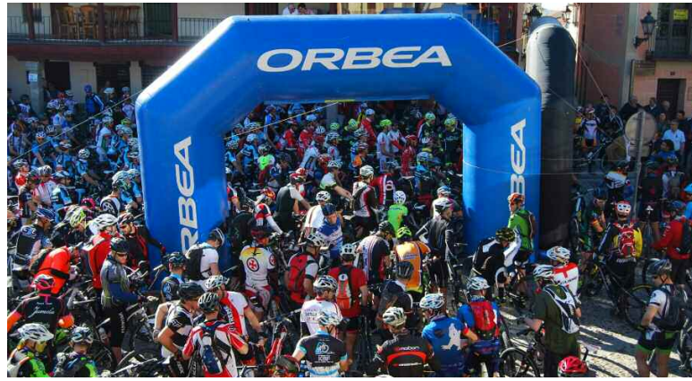
Navalcarnero al Límite, edición 2016.

Además, y como novedad este año, habrá una prueba combinada,