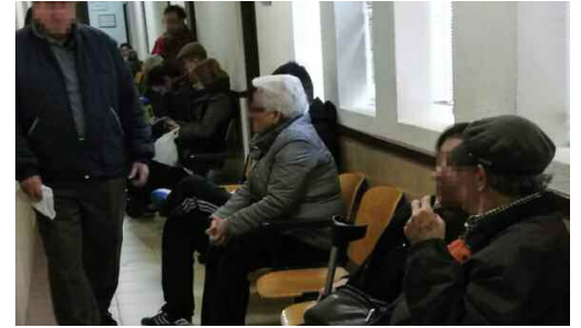
Gente esperando en los estrechos pasillos y consultas colapsadas son la tónica diaria del actual Centro de Salud.

El nuevo centro de salud de Navalcarnero va cobrando forma. Tras su inclusión en los presupuestos de 2016 gracias a una enmienda aprobada en la Asamblea por PSOE, Podemos y Ciudadanos, la redacción del proyecto entró el pasado mes de diciembre en un proceso de licitación.