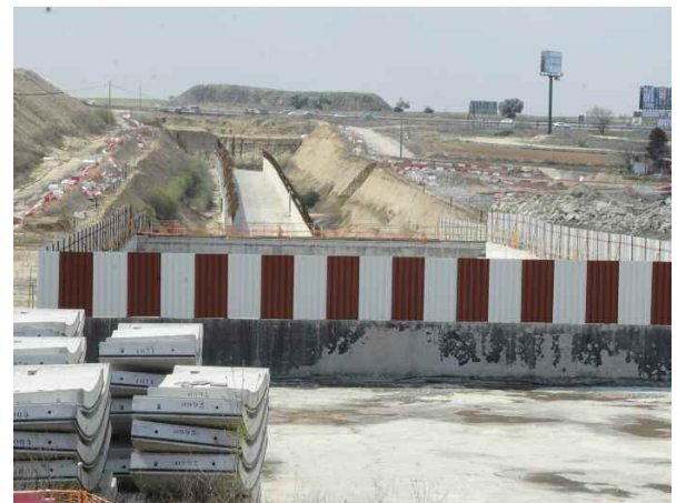
Las obras del tren están paralizadas desde hace más de 5 años.

fraestructura estaba contemplada en el Plan General aprobado desde la Comunidad de Madrid y por el que se crearon los barrios de La Dehesa, El Pinar y San Andrés. Los vecinos de estos desarrollos no pueden ser tratados como ciudadanos de segunda en materia de transporte por la administración regional, que mantiene una situación de agravio