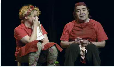
Sábados de febrero - Certamen de Teatro