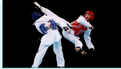
Sábado, 11 y domingo, 12 de febrero - Taekwondo