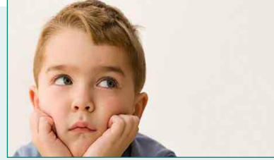
Viernes, 17 de febrero - Charla informativa TDAH