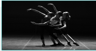
Clausura de los cursos de la EMMD