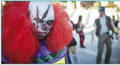
Sábado, 10 de junio - Survival Zombie