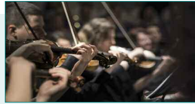
Sábado, 24 - Encuentro de bandas