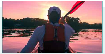
Piragüismo en el embalse de San Juan