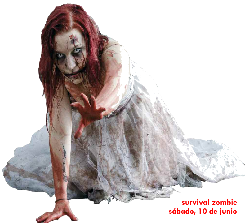
survival zombie sábado, 10 de junio

Inscripciones: en la Concejalía de Bienestar Social, hasta el 23 de junio. Plazas limitadas.