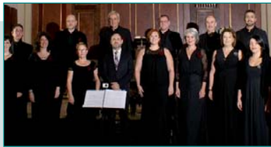
Viernes, 7 de julio - Coro de Cámara de Madrid