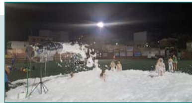
Viernes, 21 de julio - Noche deportiva