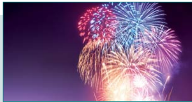
7, 8 y 9 de julio - Fiestas barrio La Dehesa