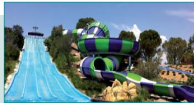
Sábado, 15 de julio - Aquopolis